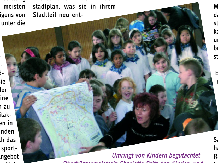
Umringt von Kindern begutachtet Oberbürgermeisterin Charlotte Britz den Kinder- und Jugendstadtplan Alt-Saarbrücken.

Erhältlich ist die sehr gelungene und wunderschöne Broschüre mit handlichem Faltplan im Caritas-Kontaktzentrum Folsterhöhe und im Servicecenter der Immobiliengruppe (Königsbruch 42), im Stadtteilbüro Alt-Saarbrücken, bei der Landeshauptstadt Saarbrücken im Rathaus und in der Touristeninfo der Stadt.