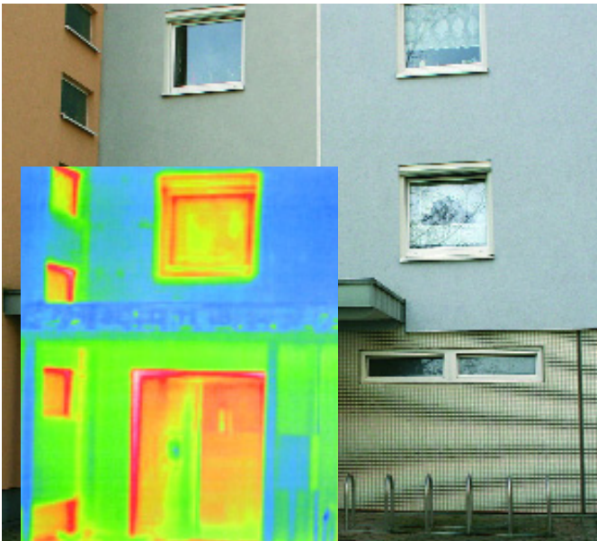
Die thermografische Aufnahme zeigt, dass die Wohnbereiche gut isoliert sind. Beim Energieausweis ist damit alles „im grünen Bereich“.

Bei Elektrogeräten und Autos ist es längst Tradition, auf den Verbrauch zu achten. Denn so kann bei den Energiekosten jährlich bares Geld gespart werden. Ab 1. Juli ist der Vergleich des Energiebedarfs auch bei Immobilien möglich: Der so genannte Energieausweis gibt Miet- und Kaufinteressenten wertvolle Informationen über den Energieverbrauch eines Gebäudes.